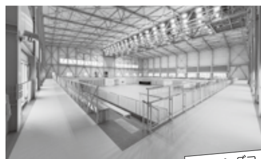
ランニングコース