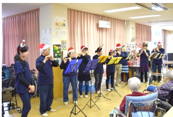
↑ 名立篠笛同好会演奏活動事業