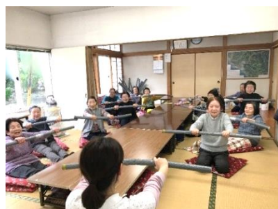
← 名立区いきいきサロン運営事業