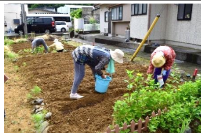
横町セントラル パークづくり事業 →