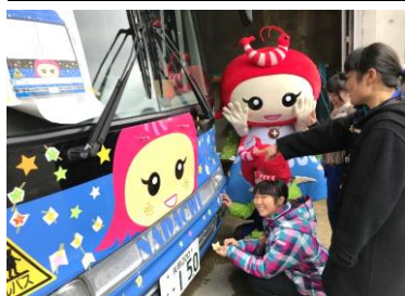
← 名五美ちゃんで名立区を元気に！事業～みんなが乗ってるバスでPR～