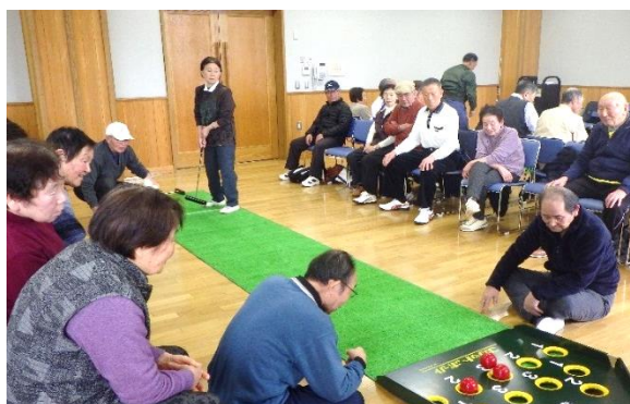
↑ 名立区老人クラブ連合会スカットボール大会事業