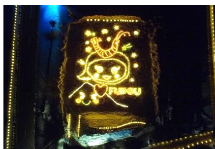
← ふるさと交流事業 (不動ミニ キャンドルロード)