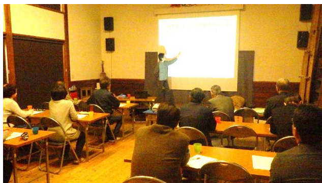
↑ 十日町市池谷集落（NPO 地域おこし）の説明