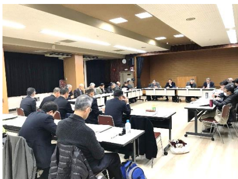
↑ 大島区地域協議会との意見交換