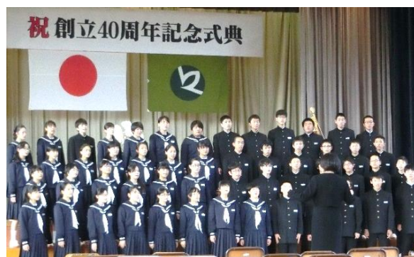
↑ 名立中学校創立40周年記念事業