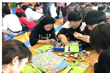
名五美ちゃん で名立区を元気に！ 事業～なごみ ちゃん de アート～ →