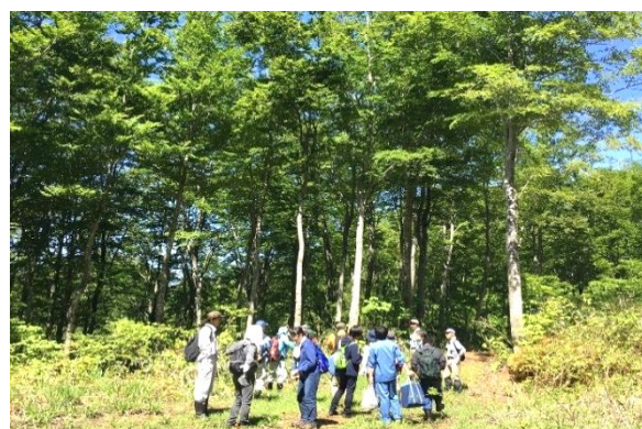
↑ ふるさと不動地区・水源の森整備活用事業