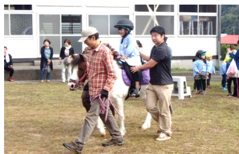
← ポニーふれあい パーク in 名立事業