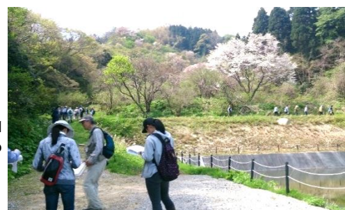
「名立 IC 前の里山・宇山 整備」と狼煙上げで賑わ いを創出する事業 (春の散策会) →