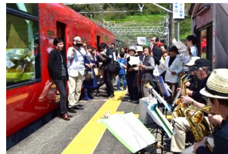
名立駅マイ・ステーション作戦事業 →