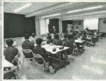
まちづくりをテーマに中学生とワークショップ