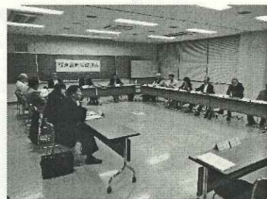
《地域協議会開催の様子》

地域協議会の詳しい説明は、『地域協議会委員の手引き』をあわせてご覧ください。『地域協議会委員の手引き』は、受付場所で配布しているほか、市のホームページからご覧いただけます。