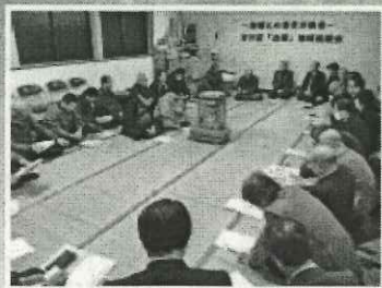
地域住民との意見交換