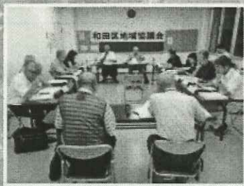
地域協議会での審議