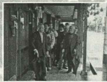
地域課題の解決に向けた現地視察