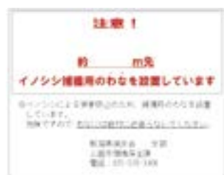
わなの周辺に設置する掲示物(例)