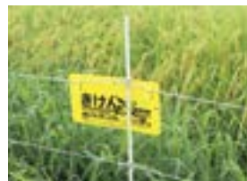
電気柵の危険表示 (例)