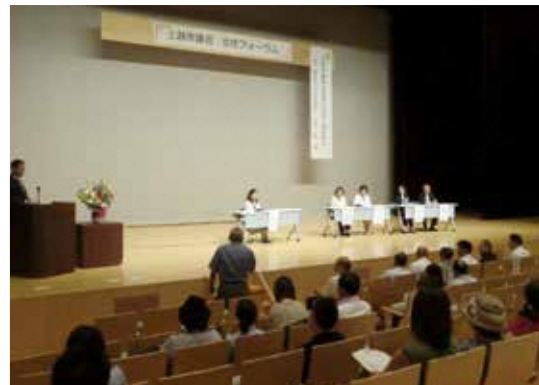
参加者も積極的に質問していました