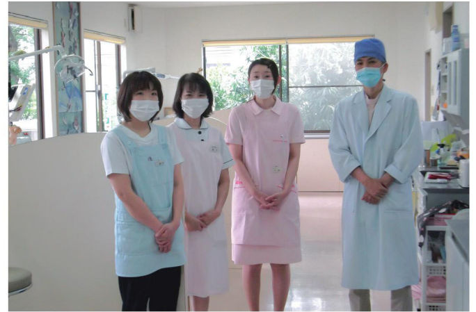
スタッフの皆さん

歯のケアがしっかりしていて歯が健康の方は、認知症はもちろん、ガン、脳梗塞、糖尿病など全身の病気のリスクが少なくなることが証明されているそうです。