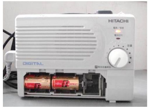
▲戸別受信機 電池の電圧が低下すると赤色ランプが点滅

また、「雑音が入って放送がよく聞こえない」、「電源が入らない」などの不具合がありましたら、総合事務所までお問い合わせください。