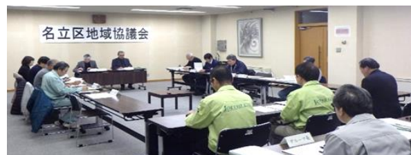
▲地域協議会の様子

令和6年4月28日までの4年間、地域と行政とのパイプ役となり、地域課題の解決につながる活動などを行っていただきます。