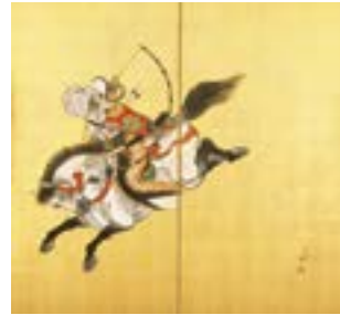
楊洲周延「流鎧馬之図」 (1910年)