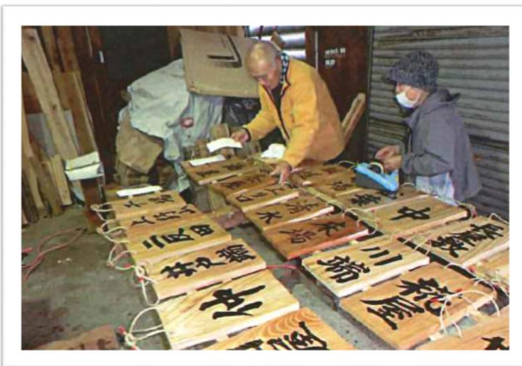
屋号を活かし、地域を活性化させる事業(牧区)