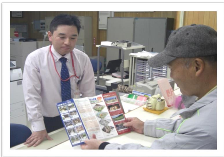
谷浜・桑取区のガイドマップ作成事業(谷浜・桑取区)