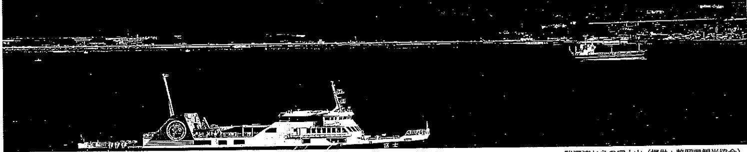
駿河湾からの富士山