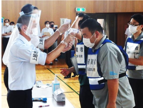
体温計測のイメージ