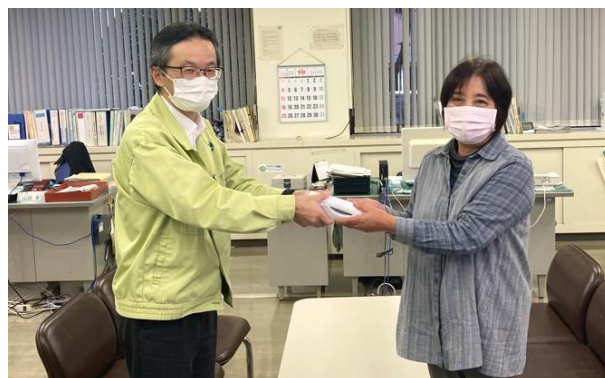
▲総合事務所長（左）から電話を受け取る当選者

10月12日から20日までの間、総合事務所ロビーに展示していた防犯機能付き電話のプレゼント抽選会が行われ、10月29日（木）に当選者に電話を贈呈しました。 当選者の方は、「電話機を買い替えるタイミングだったので、当選して嬉しい。防犯機能をオレオレ詐欺や儲け話詐欺などの特殊詐欺被害防止に役立てたい。」と話していました。