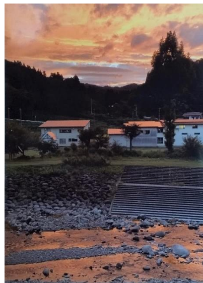
▲金賞に選ばれた No.6 「夕映え」

10月25日(日)～11月3日(火・祝)に、ろばた館で開催された「上名立地区作品展」と「ふるさと上名立フォトコンテスト」。たくさんの方にご来場いただき、ありがとうございました！「ふるさと上名立フォトコンテスト」には11点の作品の応募があり、来場者の皆さんからの投票によって、金賞・銀賞・分館賞が決定しました。