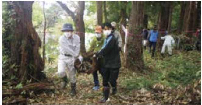
伐採木を運ぶボランティアの皆さん