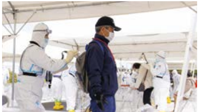
直江津港南ふ頭緑地公園で行われたスクリーニング訓練