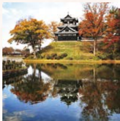
@benyamatabi2さん (撮影場所:高田城址公園)