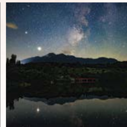
@photographroom_u さん (撮影場所:中郷区松ヶ峯)