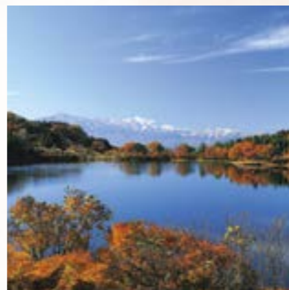
@sakuramoti0827 さん (撮影場所:清里区京ヶ岳)