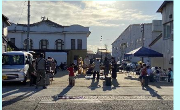
100年映画館周辺交流広場