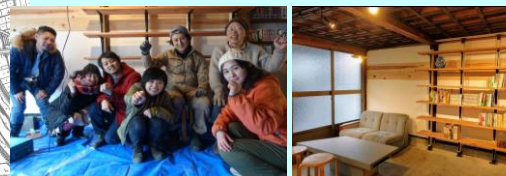
リノベーションまちづくり事業