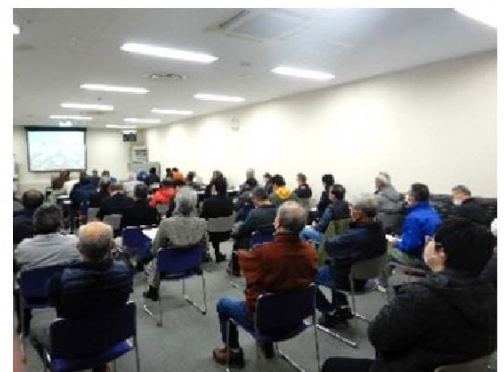
一般傍聴会場の様子