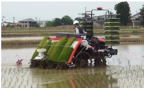
【直進キープ・可変施肥田植機】