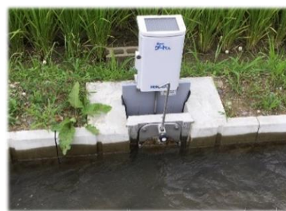
【自動給水栓（開水路）】