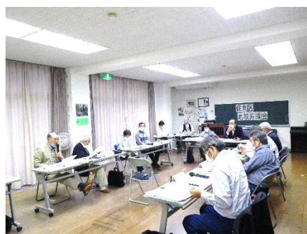
【提案者へのヒアリング及び採択審査の様子】