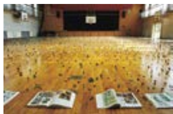
「名称の庭/御園」2010