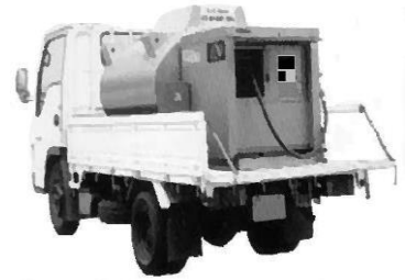
自動車等給油メーター （有効期間 7年）