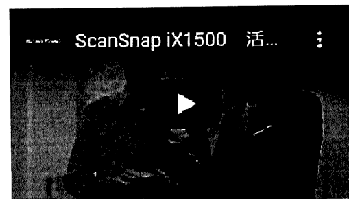
ScanSnap iX1500 オフィス編 (2分15秒)