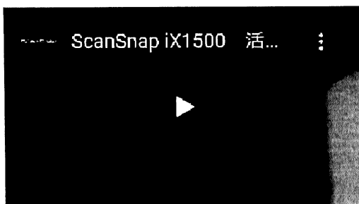
ScanSnap iX1500 ホーム編 (2分20秒)