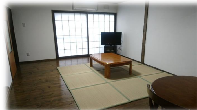
(約16.5畳の共有リビング)