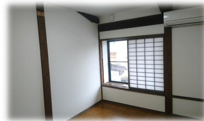
(白い壁で清潔感のある個室)