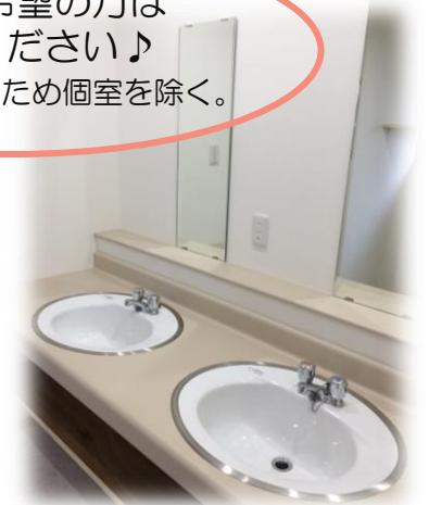
(広々とした清潔感のある洗面台)