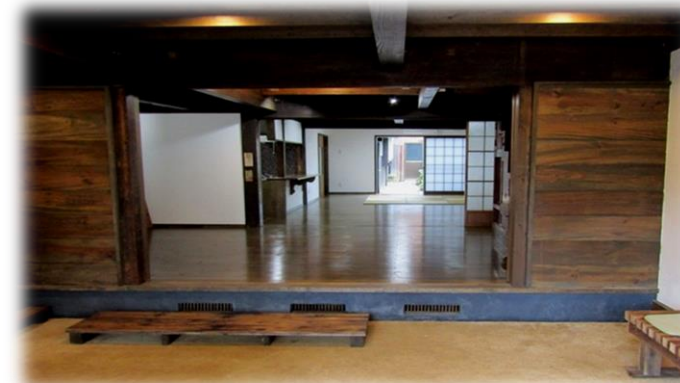
(玄関先の土間から奥の小庭)

上越市では、学生の皆さんから「まちなか」に居住していただくため、平成29年7月から、高田地区(大町地内)にシェアハウスを開設しています。このシェアハウスは、築100年を超える町家を改修し、昔ながらの土間と吹抜け、町家のしつらえを再現した「和モダン」な住宅です。学生の皆さんが町内会やコミュニティと触れ合い、溶け込むことで、「まちのにぎわい」や「地域の活性化」につながることを期待しています。