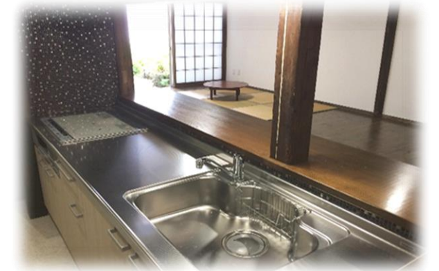
(火を使わないIHの対面キッチン)