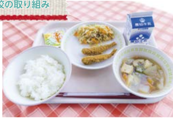
7月19日の「ふるさと献立」の日には、郷土料理の「のっぺ汁」が登場