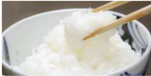
品種名の由来のとおり艶やか