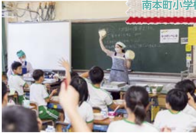
「のっぺ汁」に入っている冬瓜と夕顔の違いについて紹介