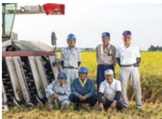
農事組合法人大西の皆さん