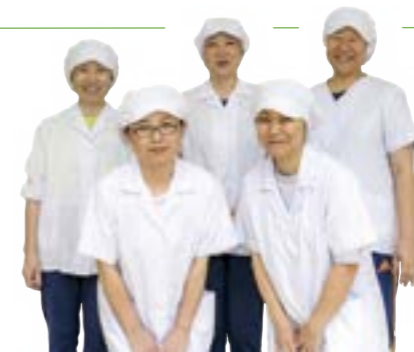
大潟町小学校の調理員の皆さん

大潟町小学校は校内で給食を作る「自校給食」です。メニューに合わせて温かい料理や冷たい料理を提供できるよう、段取りや冷蔵庫保管などを工夫しています。学校生活の節目などに、メッセージカードを添えると、裏面に「おいしかったよ」とお返事が届きます。その双方向の関係がうれしく、励みになります。