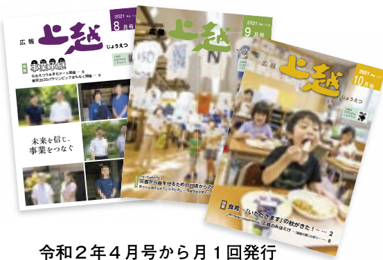
令和2年4月号から月1回発行

答 ／公式SNSを活用して市政情報を発信している。また、催し物案内の掲載締切を広報上越の作成日程表でお知らせするなどしている。