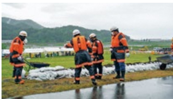
消防団が実施する水防訓練の様子

問 ／消防団の需要が変わらない中で定数削減は、1人当たりの負担増につながるため、待遇改善の必要があるのではないか。 答 ／団の体制を整理して訓練にかかる負担を減らすことを協議している。