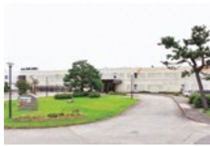
現在の上越地域医療センター病院