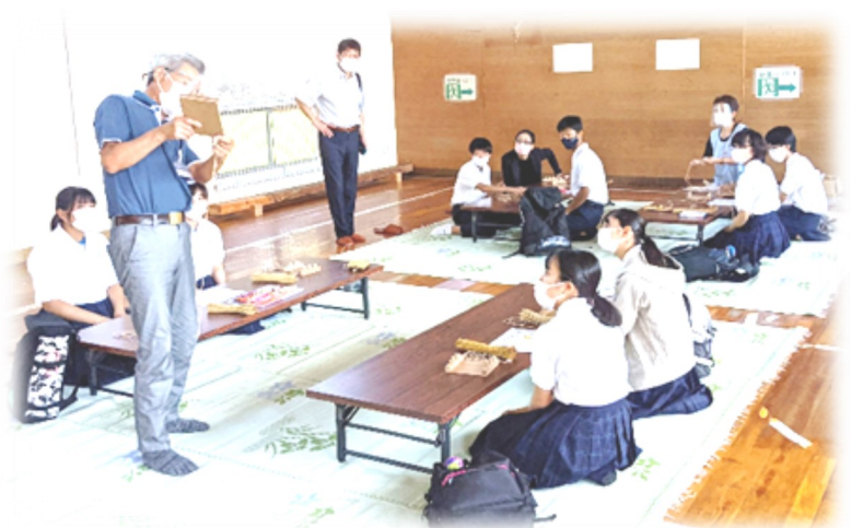
わら細工(わらマット)

次回のワークショップは、12月に開催を予定しており、月影の郷を拠点とした交流促進に向けた具体的な取組や役割分担などをまとめていくこととしています。引き続き、皆様のご協力をお願いします。