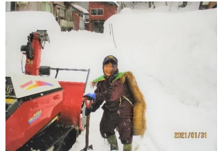
▲金賞に選ばれた「やれやれー安心」

賞にもれた作品も、どれも上名立の風景や人物を切り取った素敵な作品でした。入賞作品は、1年間上名立分館に展示します。当施設をご利用の際には、ぜひご覧ください。