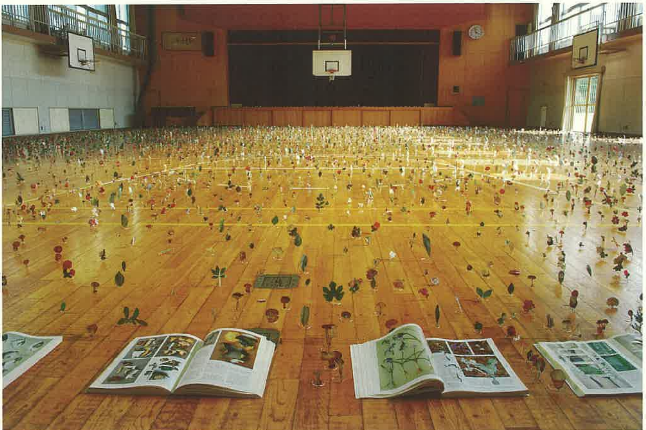
「名称の庭／御園」2010

数十冊のキノコ植物図鑑から図版のみを切り抜き、屋台会館全体に展示します。人が確認し名前を付けた植物は再度無名のイメージとして花園となり、ドブネはかつて海だったイメージを想起させ、そこに「海の園」が出現します。