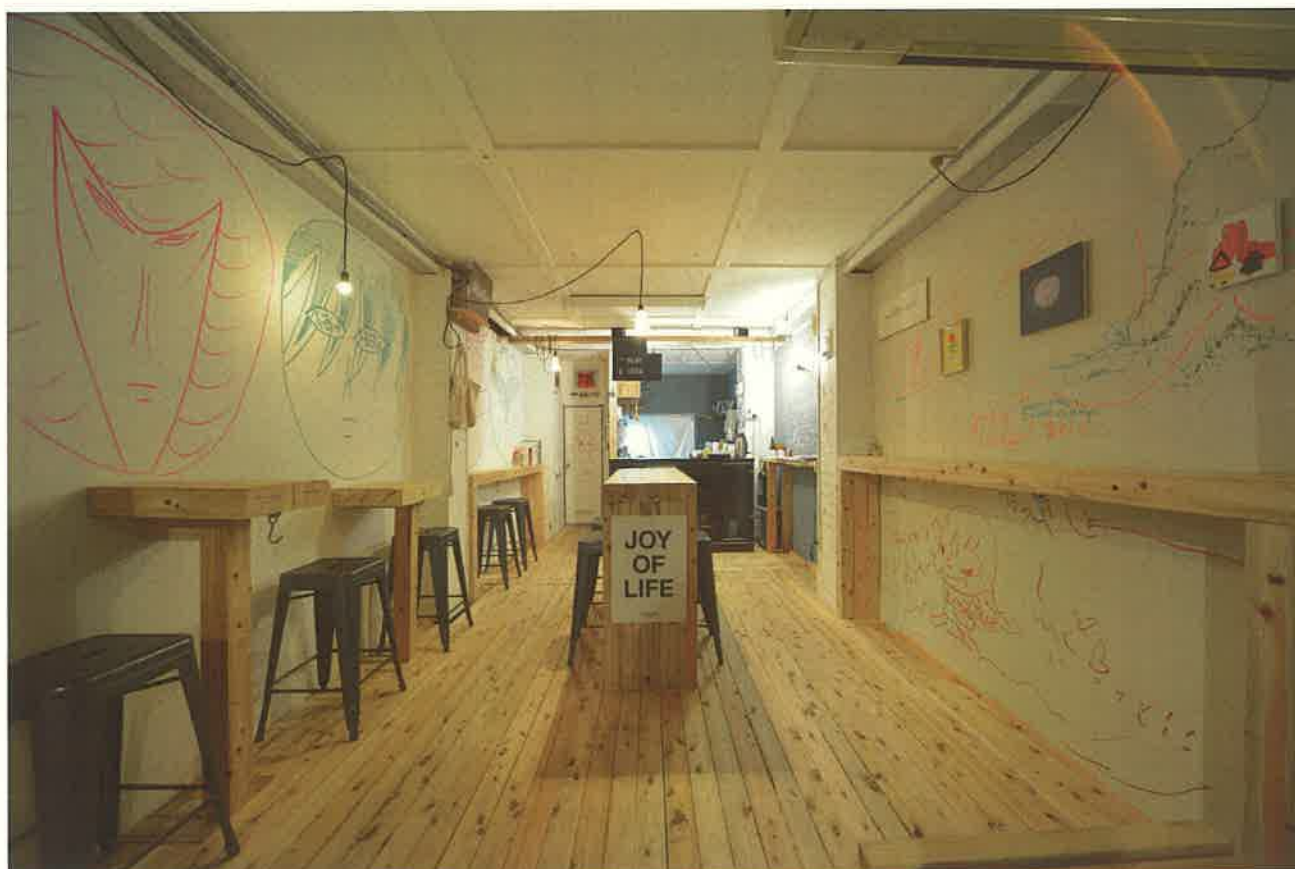
VISITOR CENTER AND STAND CAFE / 2013 / 名古屋

L PACK. と青田真也とのコラボレーションイベント。1日限定のアーティストマーケットを開催。なお、えつうみまちアートの参加アーティストのグッズや、直江津限定の飲食メニューが登場します。ここからアーティストとの出会いや新たなコミュニティをつくり出します。