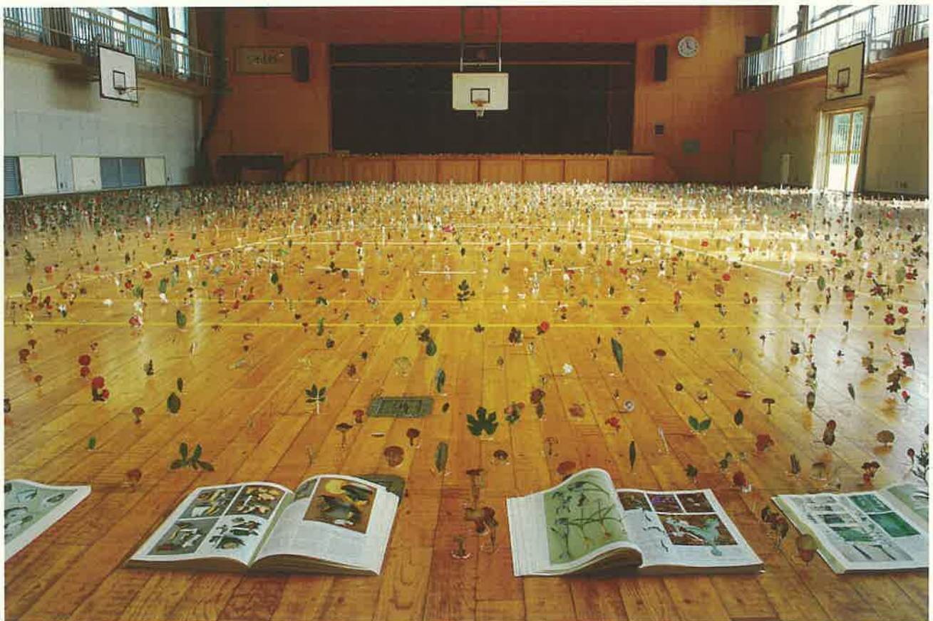
「名称の庭／御園」2010

数十冊のキノコ植物図鑑から図版のみを切り抜き、屋台会館全体に展示します。人が確認し名前を付けた植物は再度無名のイメージとして花園となり、ドブネはかつて海だったイメージを想起させ、そこに「海の園」が出現します。