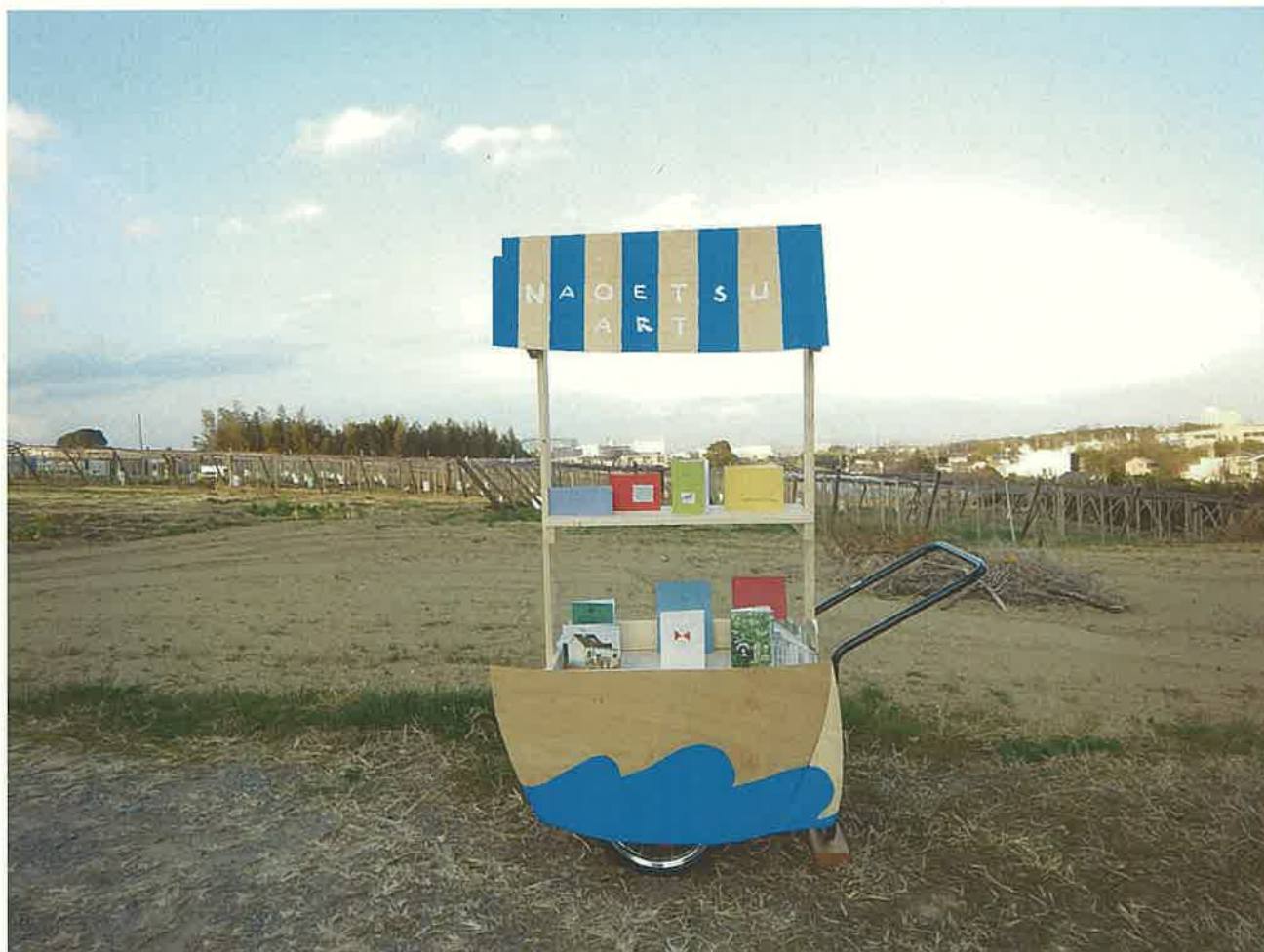
「小さな屋台 / 移動案内車」2021

移動可能なインフォメーション・カーが「小さな屋台」になって、直江津の街中各所に登場します。