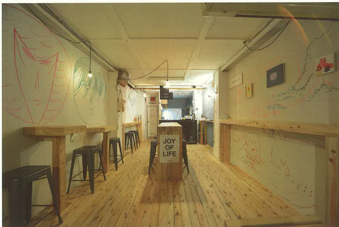
VISITOR CENTER AND STAND CAFE / 2013 / 名古屋

L PACK. と青田真也とのコラボレーションイベント。1日限定のアーティストマーケットを開催。なおえつうみまちアートの参加アーティストのグッズや、直江津限定の飲食メニューが登場します。ここからアーティストとの出会いや新たなコミュニティをつくり出します。