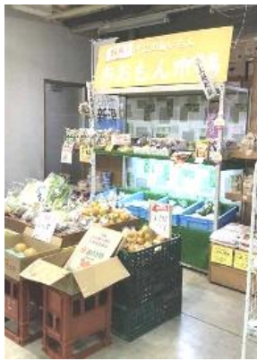
【うみてらす名立の様子】 商品が雑然と陳列されており、 見せ方に課題がある