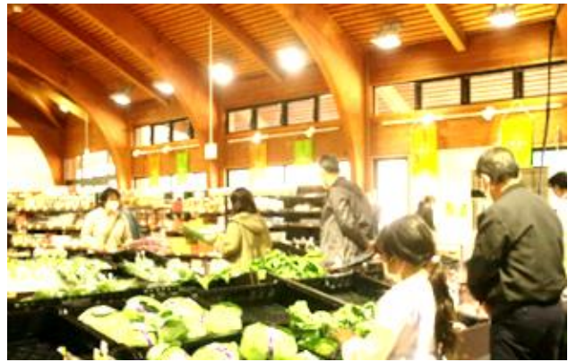
【道の駅中条の様子】 色の統一感を持たせ、見やすい陳列に リニューアル