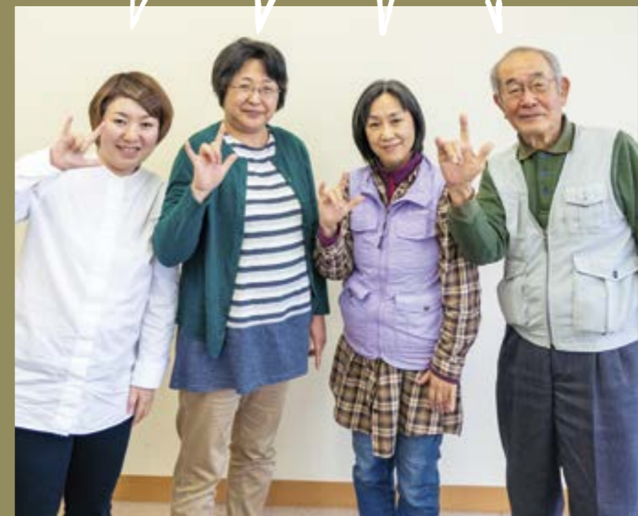
上越市ろう協会の皆さん