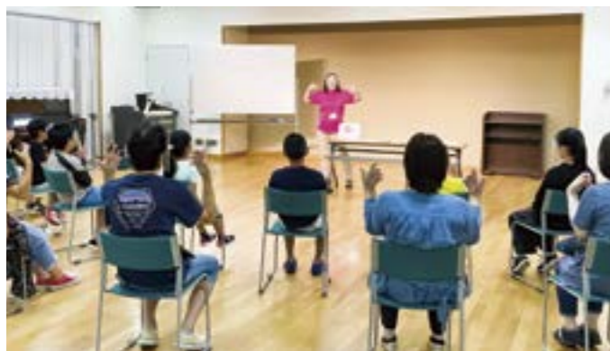
公民館事業「こども手話教室」の様子

— 市民の皆さんに知ってもらいたいことはありますか？ ろう者と話すときは、少しの間だけでもマスクを外して口が見えるようにしてもらえるとありがたいです。 また、私たちににとっては手話が第一言語です。簡単な手話でいいので、皆さんから覚えていただくと、とてもうれしいです。例えば「朝」と「傘」、「卵」と「タバコ」のように、口の動きだけでは読み取れない言葉もありますので、正しい手話でなくても、ジェスチャーをしてもらえるとコミュニケーションを取りやすくなりますので、お願いしたいです。