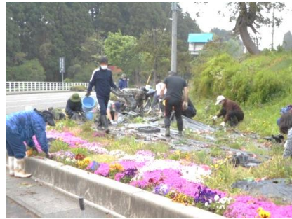
▲平山で花&夢いっぱい咲かせよう運動事業 (除草作業)

※優先して採択する事業以外の事業については、制度の趣旨や全体のバランスなどを考慮し採択します。(「その他の事業」として採択)