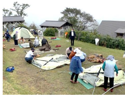
▲第2回キャンプ体験教室地域観光事業 (南葉高原キャンプ場でキャンプ体験)