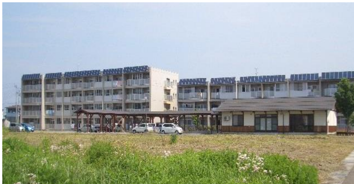
写真：市営子安住宅