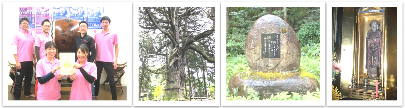
保倉川太鼓 (NPO法人保倉川太鼓)