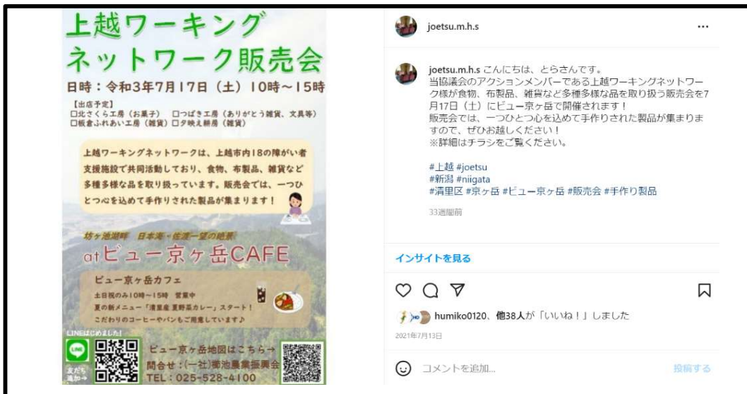
食物、布製品、雑貨など多種多様な品を取り扱う販売会開催 (上越ワーキングネットワーク)