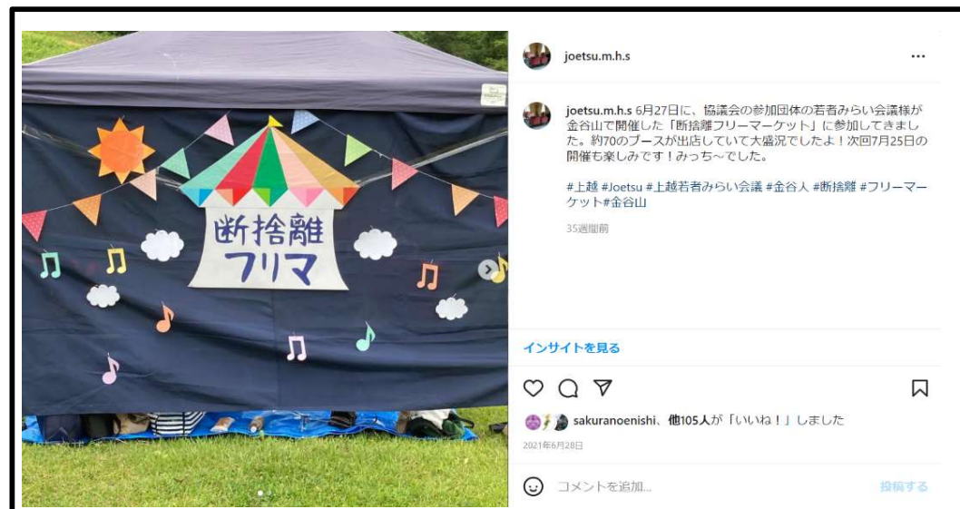
断捨離フリーマーケット開催 (上越若者みらい会議)