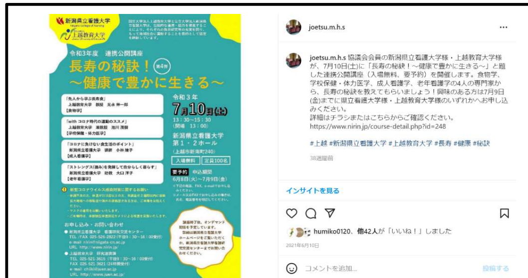
連携公開講座開催 (新潟県立看護大学・上越教育大学)