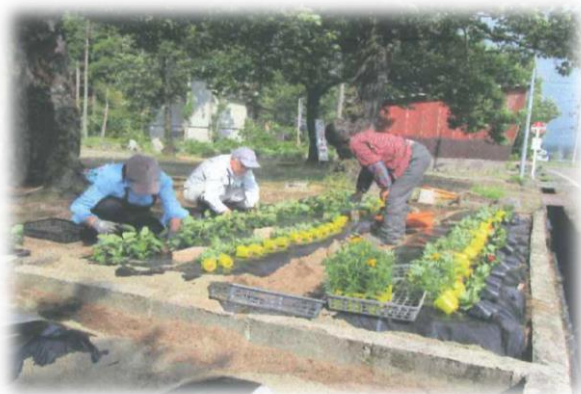
【保倉地区環境美化事業】

保倉区の地域活性化のため、事業提案を募集したところ、7件の提案がありました。協議の結果、7件全ての提案事業について採択することに決定しました。