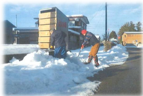
【保倉地区安全・安心な地域づくり事業】