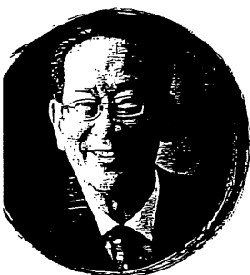
北川 正恭 早稲田大学名誉教授 元三重県知事

チーム国会が地域をより良くする 2021年7月7日(水)～8日(木) 早稲田大学 大隈講堂