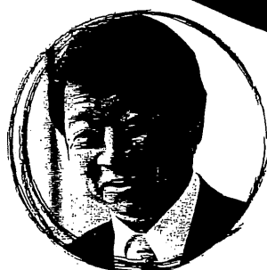
片山 善博 早稲田大学教授 元総務大臣