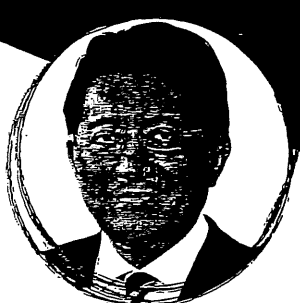
平井 卓也 デジタル改革担当大臣