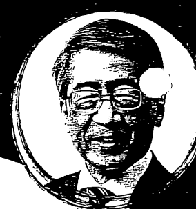
廣瀬 克哉 法政大学総長 (4月就任予定)