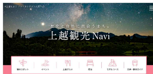
統合後の上越観光Navi