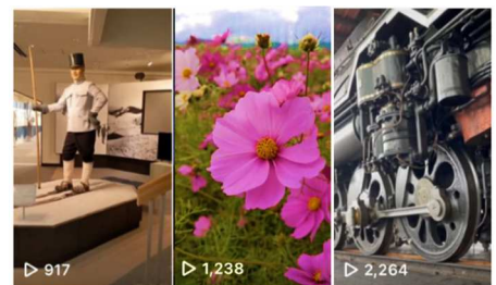
短編動画（リアル動画）