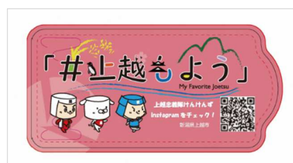
ウェットティッシュ