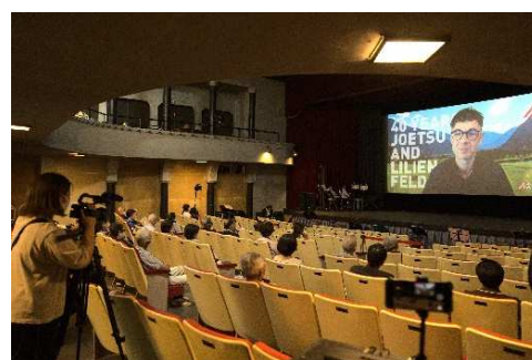
リリエンフェルト市との姉妹都市提携40周年記念事業オープニングセレモニー (高田世界館を会場にオンラインで開催)