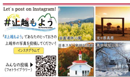
#上越もようPR用名刺カード