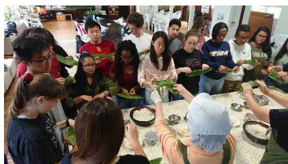
越後田舎体験受入れの様子