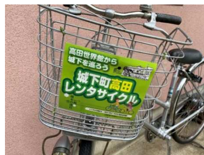
レンタサイクル用自転車