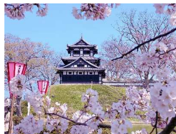
フォトコンテスト入賞作品