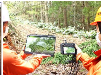
（ドローン空撮林況確認）