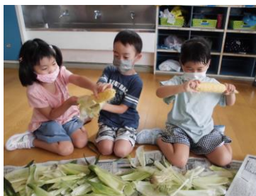
剥いた皮で制作遊び!!