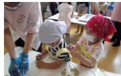
クッキーの型抜きは 粘土で練習!