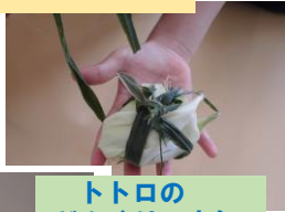
トトロの どんぐりの小包