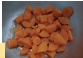
みんなで切り方を変えたら、誰が切った人参か分かったよ!