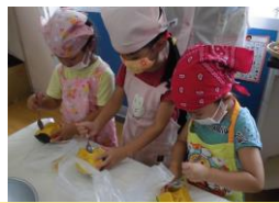
かぼちゃの種取り ～3歳児～