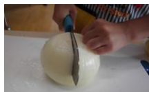
猫の手で押さえるよ!