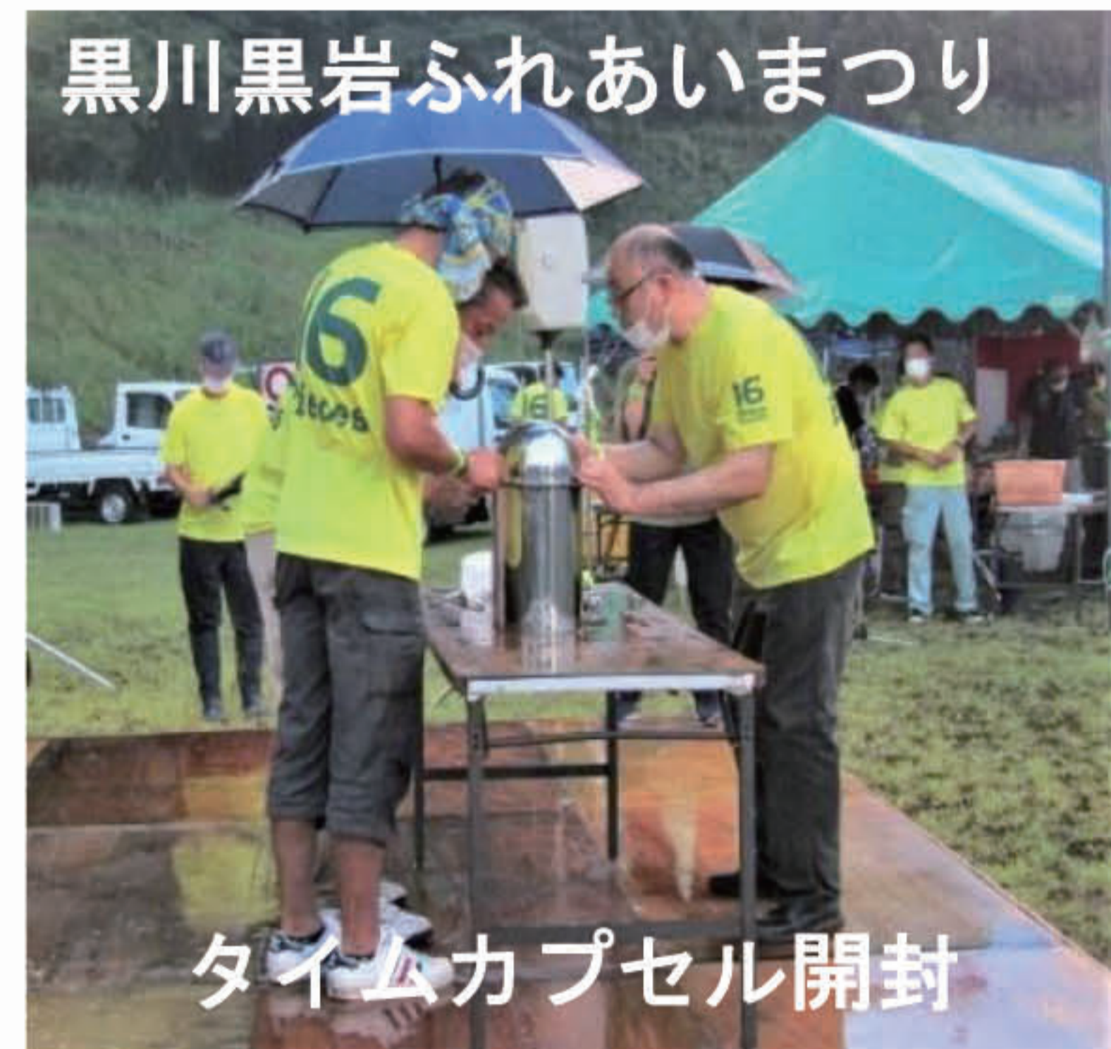
タイムカプセル開封

8月14日、旧黒川小学校グラウンドを会場に「黒川・黒岩ふれあいまつり」が開催されました。あいにくの雨模様となり、予定されたプロダラムの一部が取りやめになるなど、主催の16ピースは苦労の連続でした。それでも、黒川小学校閉校時に埋めたタイムカプセルが掘り起こされ、10年の時を超えて思い出がえりま