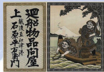
廻船問屋が年始に得意先へ送った「引き札」

また、直江津には北前船によって運ばれた笏谷石や御影石の製品が数多く見られ、「上越市地域の宝」に認定されています。