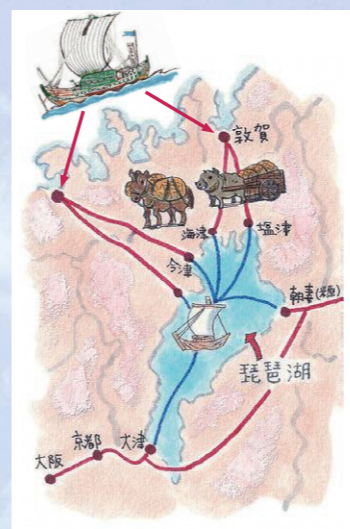
参考「水運史から世界の水へ」

北前船の特徴として依頼品を運ぶだけではなく、船頭の裁量によって売買しながら航海する「買積み」商法によって、運賃よりも格段に多い利益を上げ、船主に莫大な富をもたらしました。