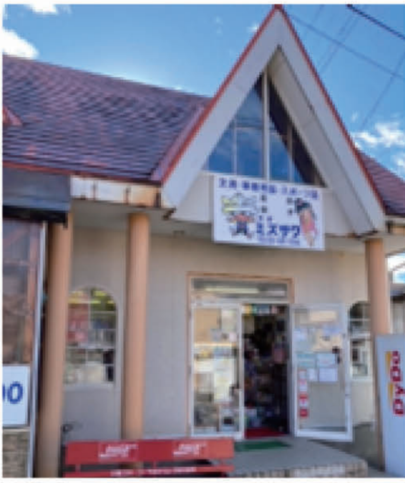
総業 74年 地域になくてはならないお店 ミズサワ