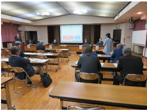
清里コミュニティプラザ