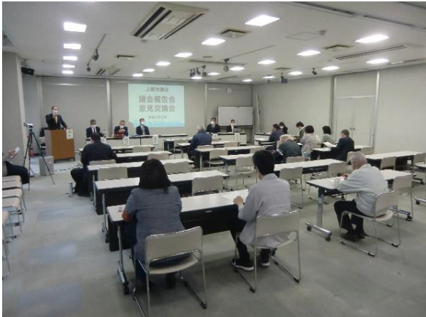
ユートピアくびき希望館