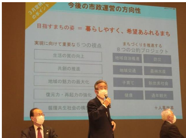
高田城址公園オーレンプラザ