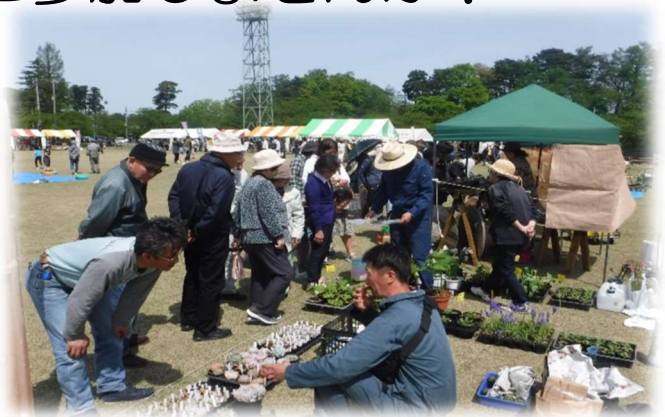
緑化フリーマーケットの様子

応募方法 『住所』、『氏名』、『電話番号』を電話又はFAXなどで、下記までお知らせください。