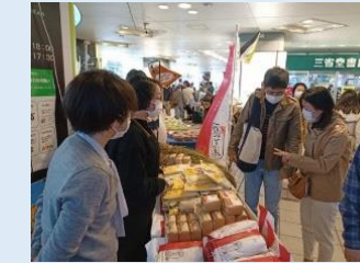
首都圏マルシェ出店

農林水産物がデザインされたのぼり旗や、商品の魅力を引き出すパンフレットを作成し、固定客を獲得しましょう。