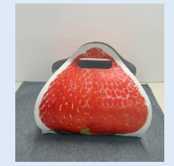
販売促進資材の作成