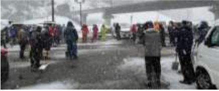
▲当日の午前中、雪の降る中、地域の人がたくさんほくほく大島駅の準備作業に参加