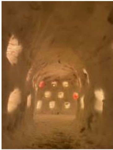
▲旭の庄屋の家前に、雪ほたるを灯したトンネルが出現!