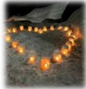
▲大島中学校生徒が制作したハートの雪ほたる(ほくほく大島駅の入口前)