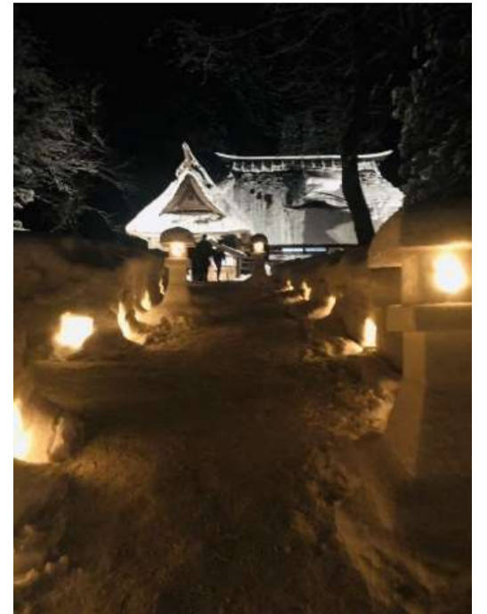
▲菖蒲の飯田邸が綺麗にライトアップ