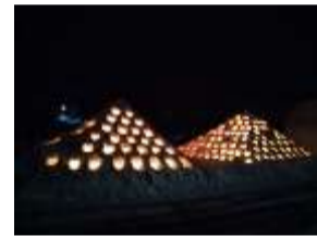
▲三竹沢地域内の本山商事横