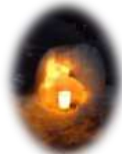
▲やわらかい灯りが綺麗!