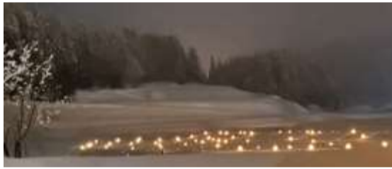
▲仁上会場の入口でお出迎え