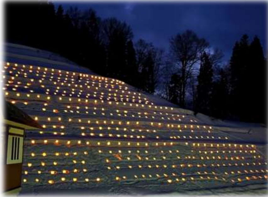
▲ほくほく大島駅の斜面に約1,000匹の雪ほたる