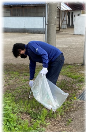
昨年の春のエコウォークの様子