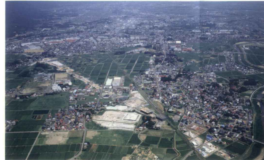
※ 写真中央が建設中の (仮称)上越駅 (平成 20 年 8 月撮影)

景観や建築、造園などに知見を有する有識者並びに学識経験者、経済団体、地域住民代表、公募市民など 10 名以内で組織。