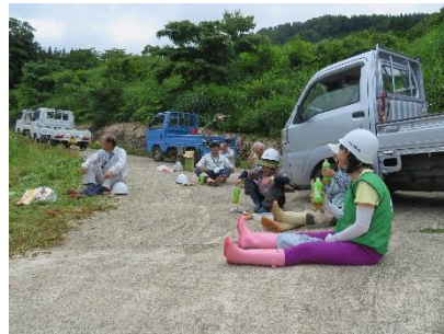
地域の方との交流