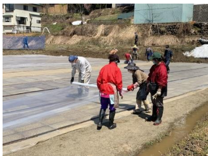
育苗箱の運搬、敷設作業